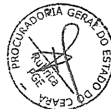
Elmano de Freitas da Costa GOVERNADOR DO ESTADO DO CEARÁ