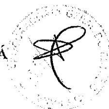
Maria Izolda Cella de Arruda Coelho GOVERNADOR DO ESTADO DO CEARÁ